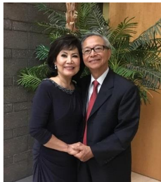
Bây chừ gặp lại...