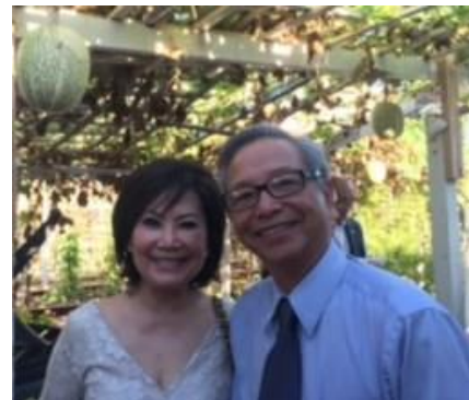
Bầu hay bí?

được vài điều đáng ghi nhận. Điều đầu tiên là cung cách lái xe của dân vùng Orange County (OC). Ở đây không đề cập tới khu vực được gọi là Bolsa (hay Little Sài Gòn). Dân ở đây lái xe tương đối “tử tế” hơn dân Houston (mình là dân Houston). Về tốc độ, sau mấy tuần ngồi trước tay