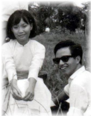
Năm hồi năm...