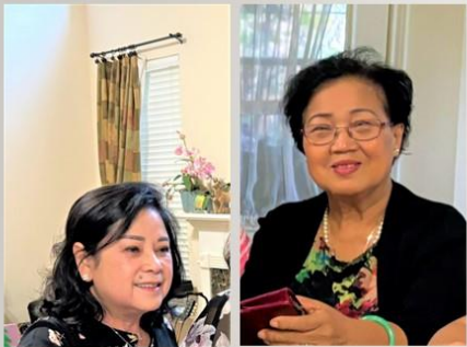
2 thuyết trình viên Insurance 7 Li & U13 Minh