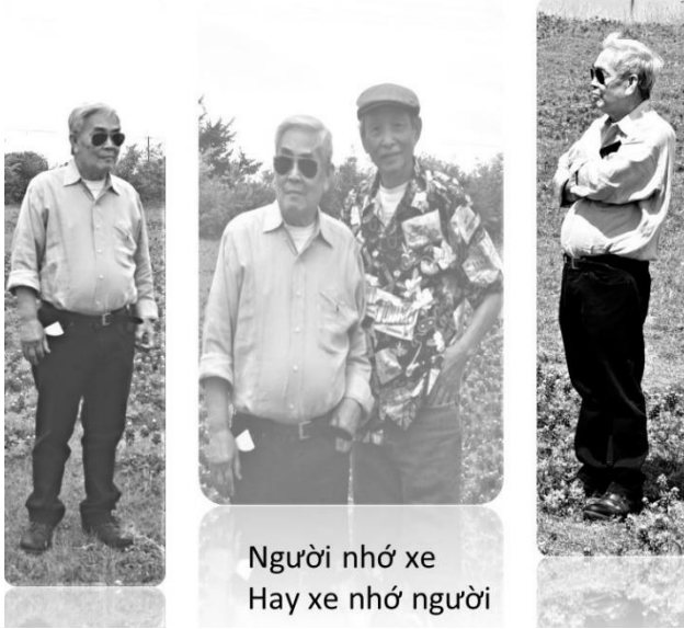
Người nhớ xe Hay xe nhớ người