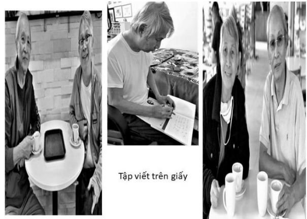
Tập viết trên giấy

anh mò mẫm viết trên những trang giấy không hàng không lối. Con anh chở đi bác sĩ suốt cả năm trời nhưng bệnh tình không có dấu hiệu thuyên giảm. Anh rất buồn và mỗi lần muốn gặp bạn bè thì tôi ghé nhà chở anh đi. Cách nay hai năm anh di chuyển về tiểu bang North Carolina để tiếp tục