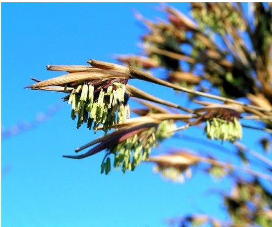
Tre ra hoa vào mùa xuân trong một khu vườn ở Roskilde, Đan Mạch.

úa và không bao giờ tự hồi sinh, mà phải nhờ đến bàn tay con người trồng lại. Một giả thuyết cho rằng, việc “độc sức” cho quá trình sinh sản này đòi hỏi ở cây tre sự tổng hợp năng lượng khổng lồ, khiến cây không còn sức sống sau khi trở hoa. Giả thuyết khác lại cho rằng, các cây mẹ chết để nhường chỗ cho các cây con.