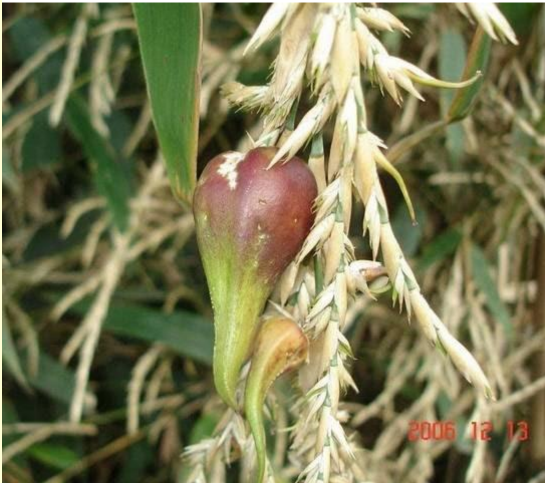
Hoa tre và quả tre.