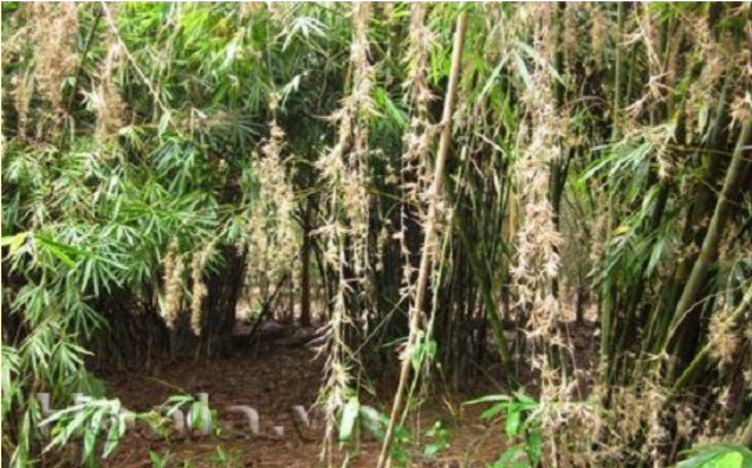
Bụi tre ra hoa.

Chu kì nở kì lạ chính là một bí ẩn của hoa tre. Theo kinh nghiệm truyền lại từ nhiều thế hệ, phải từ 60 đến 100 năm, tre mới nở hoa một lần. Một khoảng thời gian dài bằng cả một đời người, thế nên có những người cả đời không biết đến bông hoa tre không phải là chuyện xa lạ.