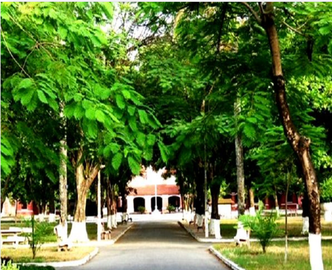
Lối vào từ cổng trường Đồng Khánh xanh rì bóng cây phượng

Khi biết anh là khách của gia đình nàng, bác Đệ -gác cổng- cho vào. Xe từ từ chạy theo hàng phượng cao vút được trồng dọc theo lối đi, dài vào bên trong sân chơi theo hình chữ thập, chia sân thành bốn khoảnh cỏ xanh mát, nằm cân đối chính giữa trường, hai ô cỏ nhỏ hơn nằm ngay hai bên cổng giữa, lối đi riêng cho giáo sư.